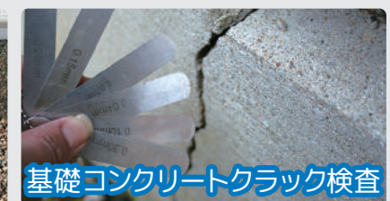
基礎コンクリートクラック検査